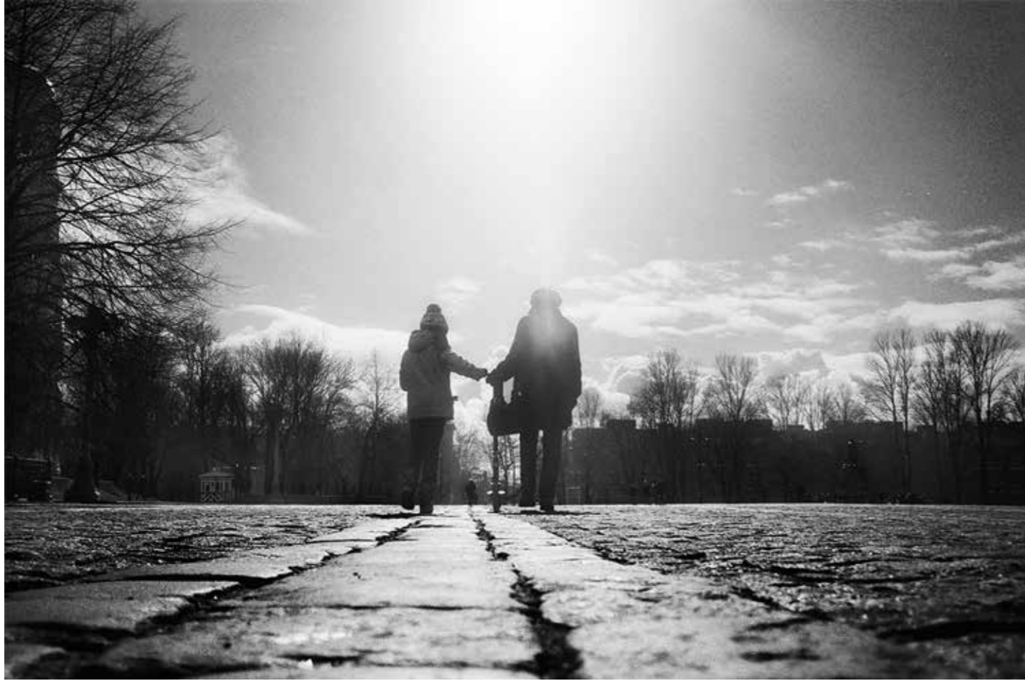
Не бойся, я с тобой