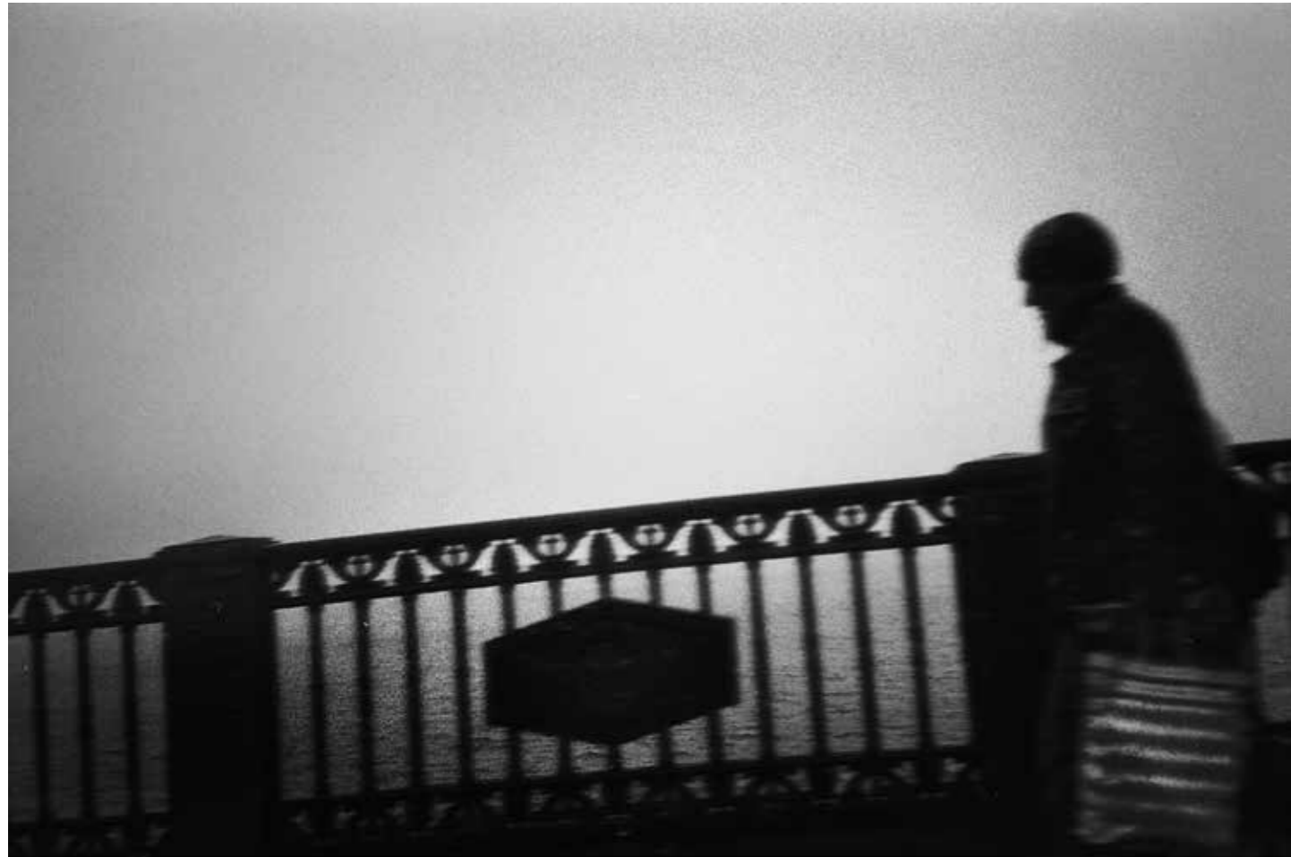
Зима, весна и снова зима