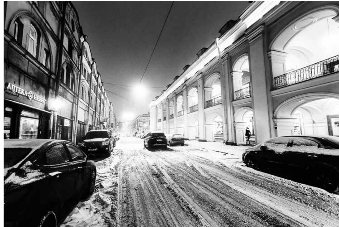
Ночь, улица, фонарь....