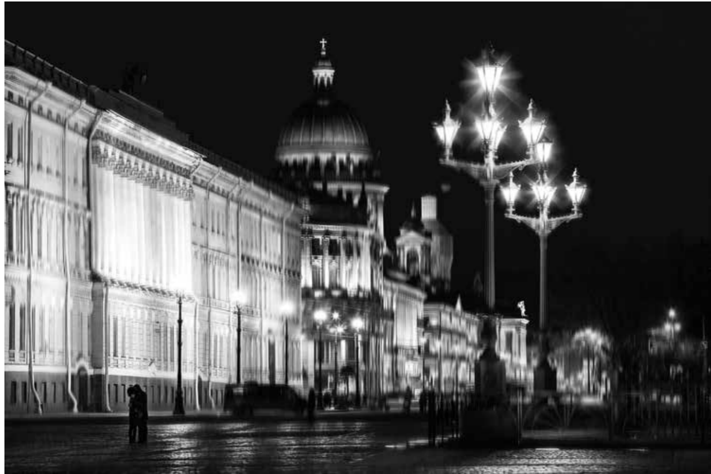
Любовь в большом городе

с. 34. Главная городская площадь с. 35. Первая борозда с. 36. Заземление