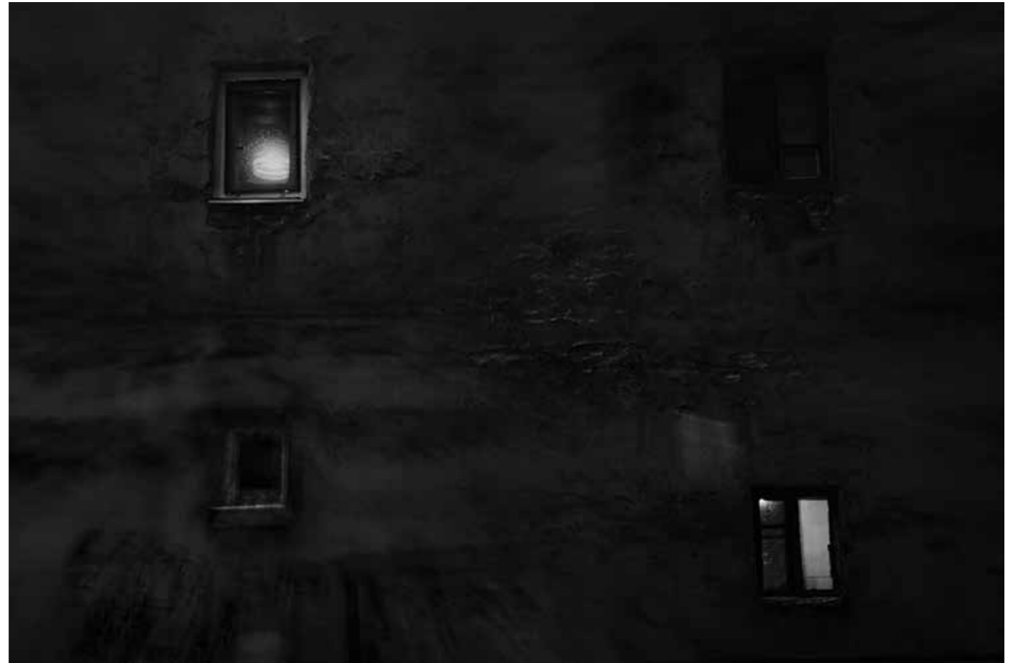
Окна, плывущие по реке времени