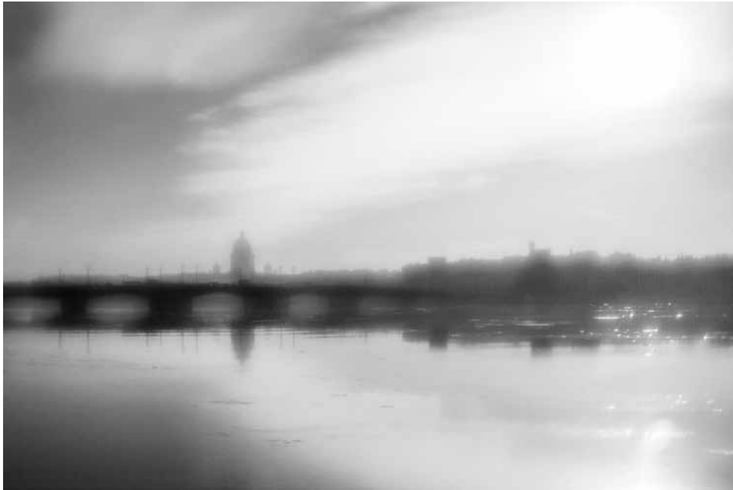
Когда-то двести лет тому назад