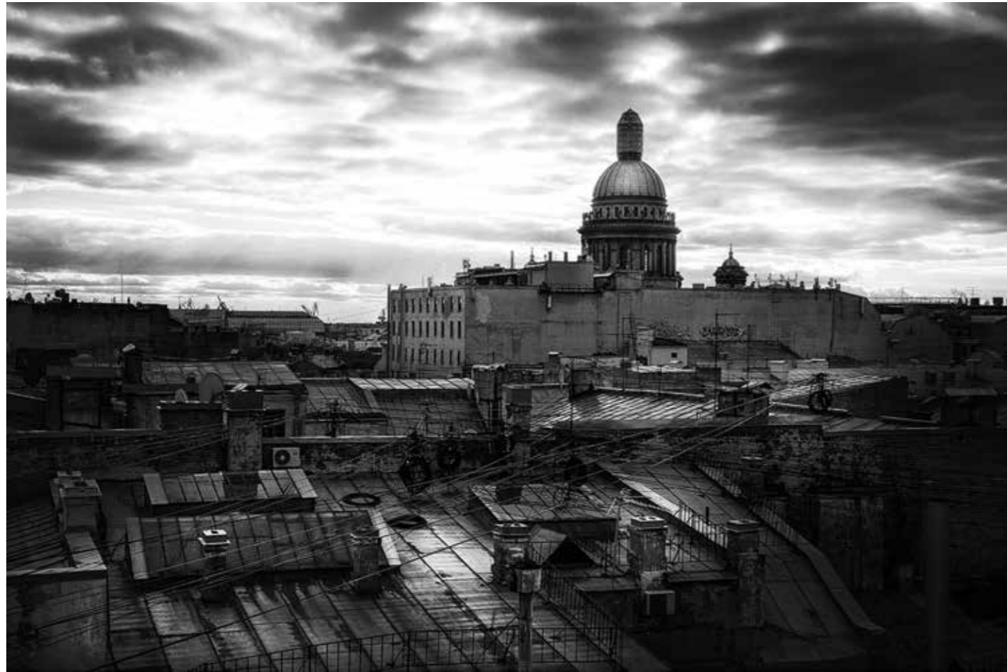
Серебро Господа моего