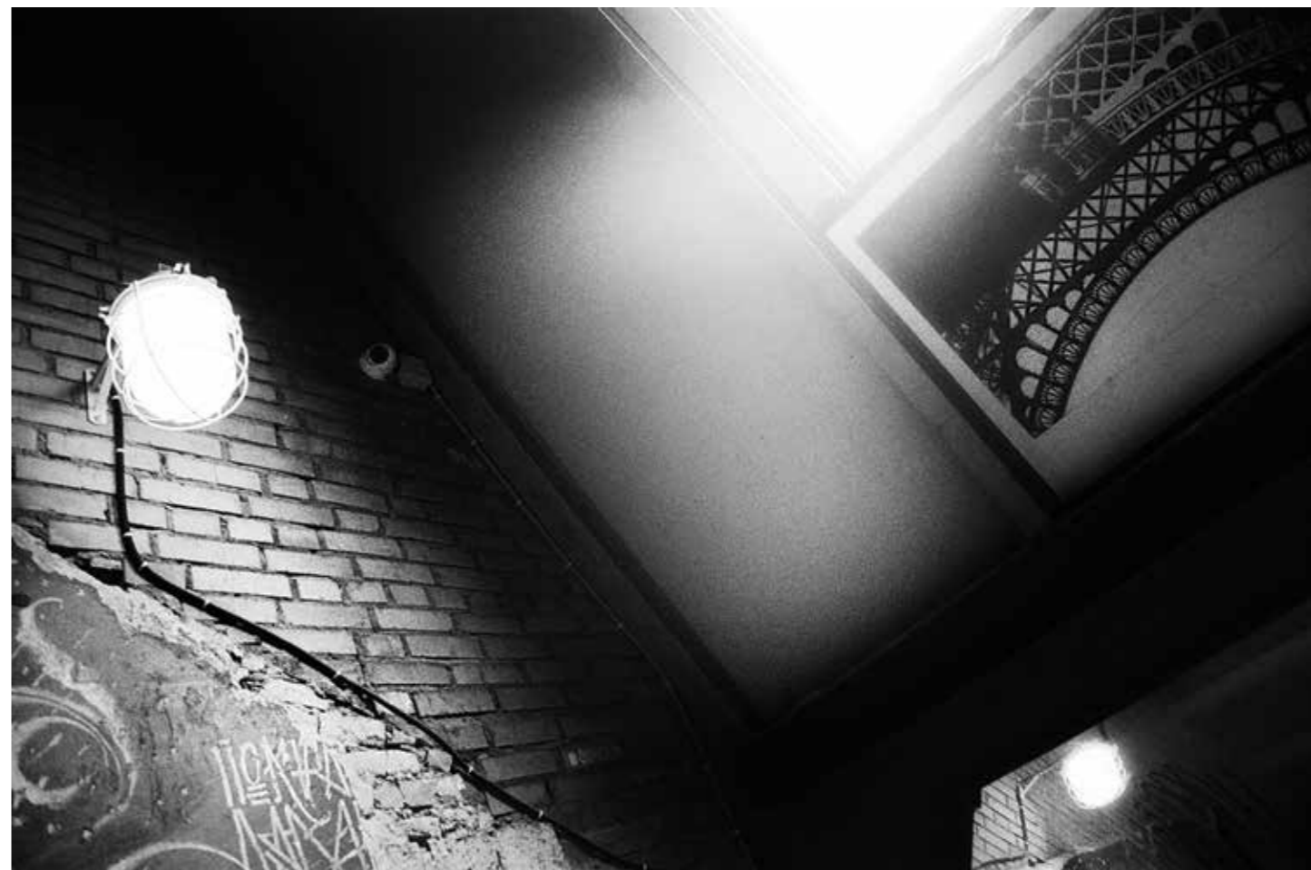
Окно в Париж